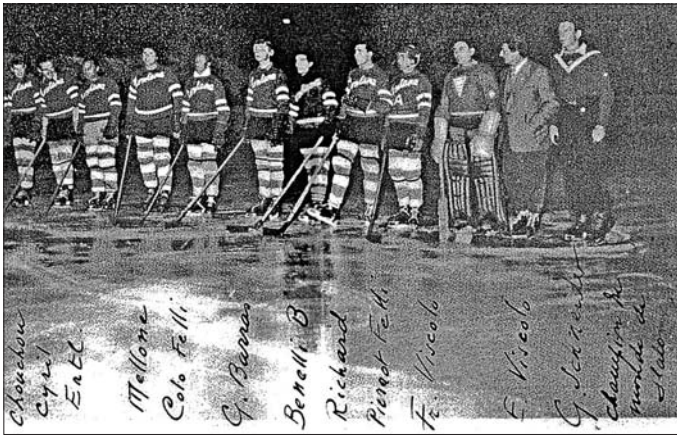
3 janvier 1951: Montana I - Cambridge Université I, stade d'Ycoor.