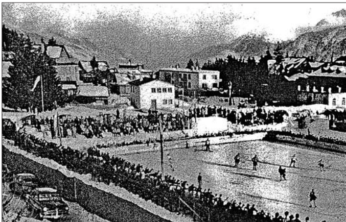
29 janvier 1951: Montana renforcé - Zürich I, stade d'Ycoor.

L'activité du club se borne, dans les premières années, à l'organisation de rencontres amicales sur le lac Grenon.