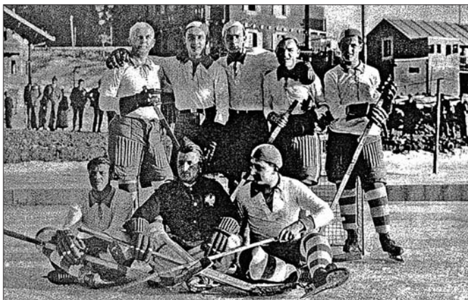
Match du 27.12.1931, Montana I - Star Lausanne I

Le premier match entre les deux équipes valaisannes est organisé la même année sur le lac glacé de Grenon.